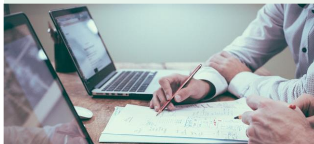
Prüfung Status Quo