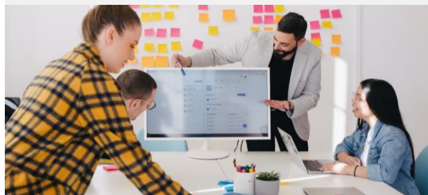
Gemeinsames Verständnis schaffen